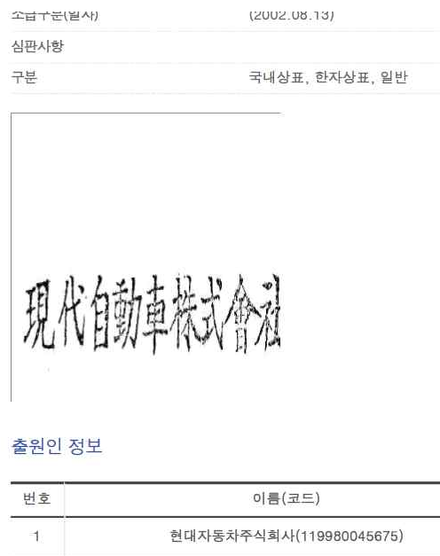
Figure AppA2-4. Registered Trademark of Hyundai Motors