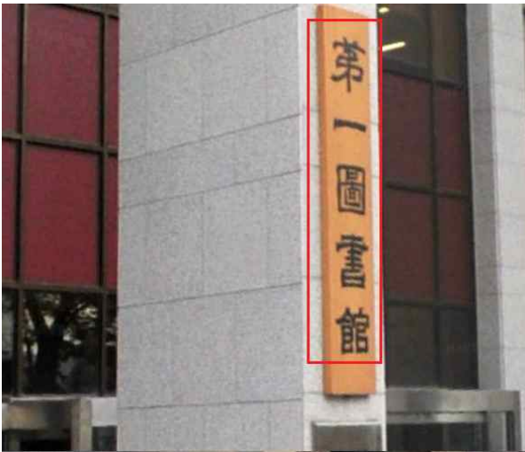
Figure AppA1-2. The First Library written in Hanja (第一圖書館)