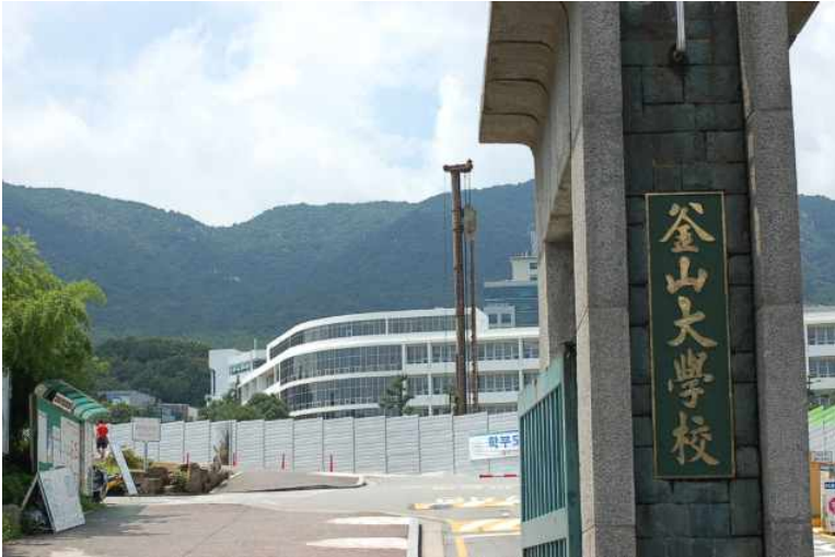
Figure AppA1-1. Pusan National University written in Hanja (釜山大學校)