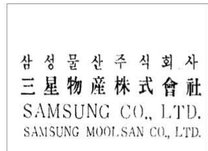
Figure AppA2-1. Registered Trademark of Samsung Moolsan Co., Ltd.