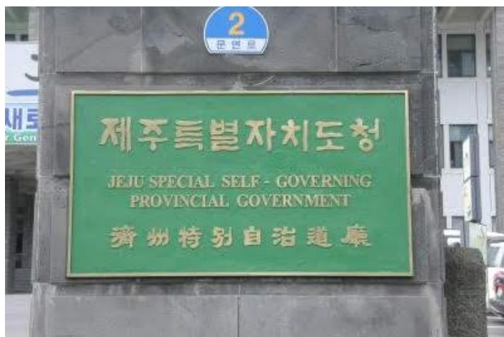
Figure AppA1-4. Jeju Special Self-governing Provincial Government (濟州 特別 自治道廳)