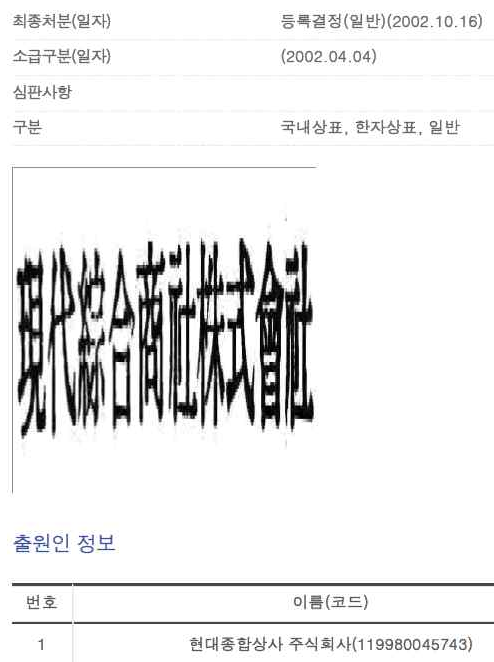
Figure AppA2-5. Registered Trademark of Hyundai Jonghabsangsa